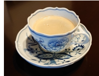
マイセンの コーヒーカップ