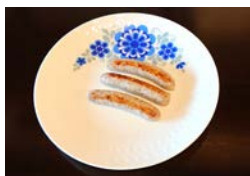
D: ニュルブルンガー