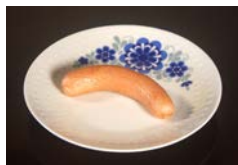
B: ポークフランクフルター